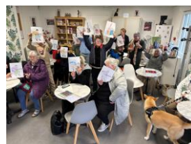
Conférence multigénérationnelle sur la guitare et animation.

TA1AMI continue à apporter de la culture auprès de populations isolées et défavorisées avec la participation de ses nombreux bénévoles.