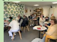
Locaux au 97 rue d'Esquermes Lille

De plus un local pour réaliser des activités culturelles a été aménagé (avec un jardin écologique et solidaire).