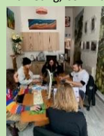
Locaux au 61 rue Nicolas Leblanc Lille

Son siège social a été refait à neuf pour accueillir des bénévoles qui mettent en œuvre toutes les actions de gestion (gestion administrative, marketing, communication...)