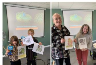
Conférence multigénérationnelle sur les animaux dangereux.

A fin septembre 2023, 1641 personnes isolées ont bénéficié de 78 activités culturelles et 399 bénévoles y ont participé.